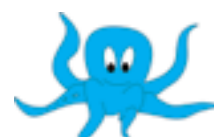
Strophe 5: Krake