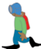
Strophe 2: Taucher