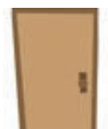
Strophe 4: Tür