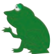
Strophe 1: Frosch

Passende Bildsymbole können zum Einüben als Erinnerungstütze an die Tafel skizziert werden. Zum Beispiel: